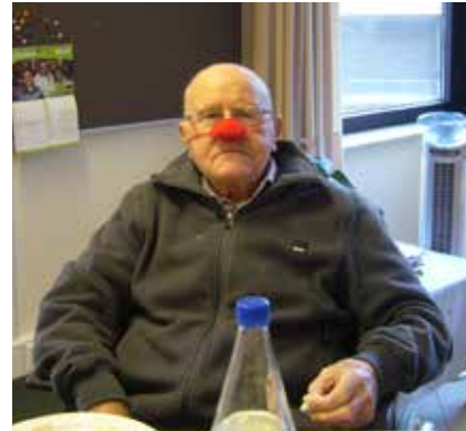
Foto van een patiënt die in de KICK!-box heeft gesnuffeld.